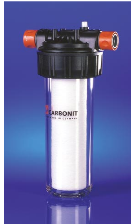
Fig. VARIO Puerto